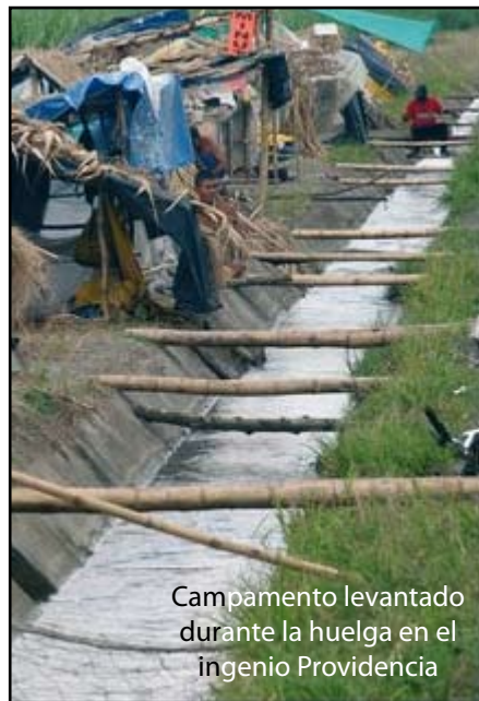
Campamento levantado durante la huelga en el ingenio Providencia

Amplíemos un poco más el zoom y acerquémonos a una de estas plantaciones, en concreto una de caña de azúcar (a partir de la cual se obtiene