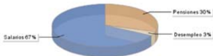
Distribución de los grupos de población