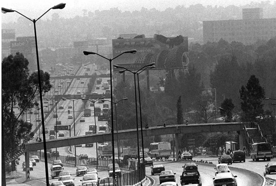
Contaminación, ciudad de México.

La problemática de la contaminación atmosférica se sitúa, con toda evidencia, en el contexto más amplio de la relación entre el medio ambiente y las actividades humanas. En el marco de este estudio nos es imposible abordar todas las perspectivas de esta cuestión, sobre la que existe una abundante literatura. Trataremos solamente ciertos aspectos que ponen de manifiesto las diferencias, según las sociedades, entre las representaciones del medio ambiente y del lugar que el hombre ocupa en él. En la actualidad la antropología estudia esta relación en dos vertientes: relación hombre/naturaleza (Descola, 1986; Descola y Palsson, 1996) y etnociencia (etnoecología) (Sefa, 2000; Nazarea, 1999). En ambos casos, sin confrontar directamente los modelos "indígenas" con los occidentales, los estudios muestran que, aunque no exista una se-